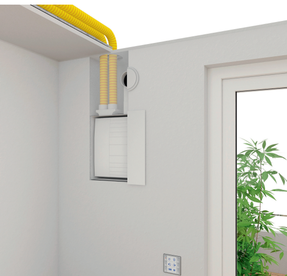
Eingebaute Komfortlüftung M-WRG U 2 mit Zweitraumanschluss.

Die Vorteile der Lüftungsgeräte M-WRG mit Wärmerückgewinnung liegen auf der Hand: Mit überschaubarem baulichem Aufwand lassen sich für jedes Objekt individuelle, wirt-