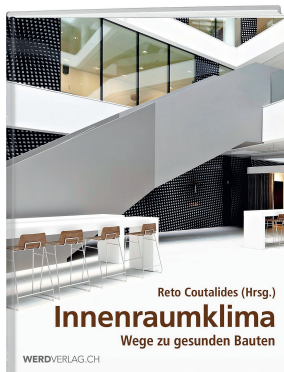
Innenraumklima-Wege zum gesunden Bauen, in der 3. Auflage

Zu der Reihe ausgezeichnete Bauten mit zertifiziertem Gütesiegel «GI Gutes Innenraumklima» gesellen sich nun ein Wohn- und Bürohaus der Firma Baufritz, der Ständeratssaal im Bundeshaus und auch das neue Bürogebäude Zürich-Uetlihof 2 der Credit Suisse; letzteres setzt neue Massstäbe hinsichtlich Arbeitsplatzgestaltung und Minergie-Standard. Unter «Messmethoden und Beurteilungssysteme» werden erstmals konkrete Zahlen und Grafiken gezeigt, mit denen das Innenraumklima und die Zuluft von zertifizierten Bauten